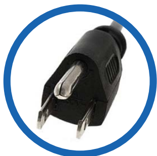
Cable de alimentación CA NEMA 5-15P