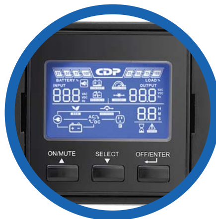
Panel LCD con rotación de 90°