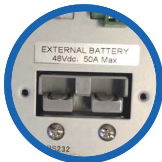
Entrada banco de baterías externas