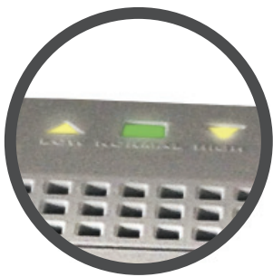
LEDs bajo/alto voltaje y operación normal.

Esta línea de reguladores de voltaje, corrige altas y bajas tensiones de fluido eléctrico, que causan daños a PC's y sus accesorios de CA. El diseño se completa con un supresor de voltaje de alto desempeño que absorbe picos y altos voltajes, componentes incorporados para la filtración de ruidos armónicos que dañan circuitos lógicos de la computadora y su protector de picos y altos voltajes en línea telefónica y DSL para complementar una solución ideal de protección a su inversión de problemas agudos de energía.