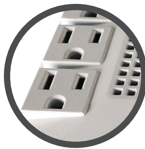
8 Tomas con protección de sobretensión y protección AVR.