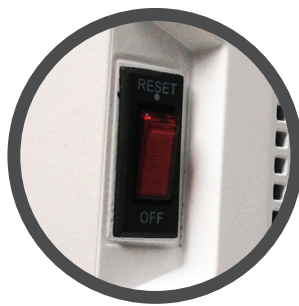
Interruptor de encendido y breaker de sobrecarga.