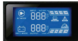
Panel de control y monitoreo LCD Nivel de carga/Nivel de Baterías Voltaje de entrada y salida/Frecuencia de salida Temperatura del equipo