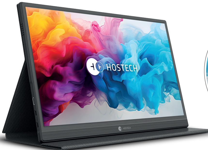
Imagen solo para fines ilustrativos / Image for illustrative purposes only