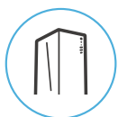
Diseño Elegante y Funcional