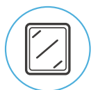
Panel Frontal de Cristal Templado